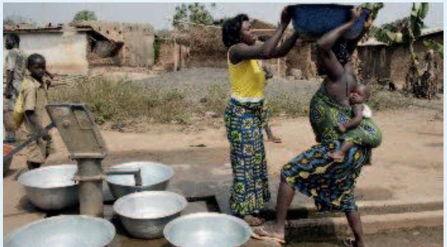
In kleinere dorpen zijn Mark III-pompen geplaatst.

Eén van de bedrijven die serieus nadenkt over betrokkenheid bij Benin, is Brabant Water. Dit drinkwaterbedrijf bezocht Benin afgelopen januari, om kennis te maken met het nationale Beninse waterbedrijf (SONEB) en de mogelijkheden te verkennen. Brabant Water heeft in Benin een intentieverklaring getekend met SONEB. Ook de Nederlandse ambassade in Benin zette zijn handtekening. Doel van de intentieverklaring is te komen tot een samenwerkingsverband tussen Brabant Water en SONEB, met vooral aandacht voor het verbeteren van de bedrijfsprocessen (zoals de inning van gelden of het opsporen van lekken), organisatieontwikkeling en kennis-overdracht.