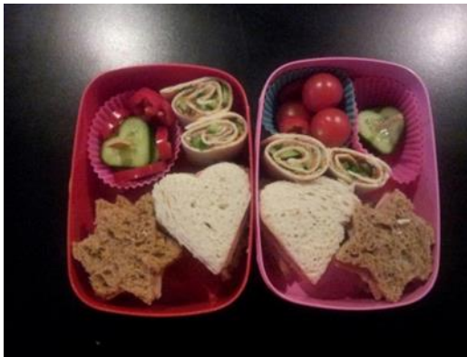
figuur 1. Nieuw vormen van brood op de plank

De financiële crisis bewijst (kip of ei?) dat traditionele verdienmodellen fors aan effectiviteit hebben ingeboet. Investeerders, projectontwikkelaars en gemeenten moeten noodgedwongen grote verliezen nemen. Daardoor zijn zowel hun ambities als hun slagkracht stevig afgenomen; het geld is schaars. Veel ontwikkelingen staan -of gaan- 'op slot', terwijl de burgers blijvende behoefte hebben aan betaalbare en duurzame voorzieningen. Veel partijen zijn naarstig op zoek naar nieuwe verdienmodellen. Wij hebben ervaren dat naast de business cases en het verdienmodel, vooral ook het proces van totstandkoming het succes bepaalt. In dit artikel besteden we aandacht aan beide aspecten.